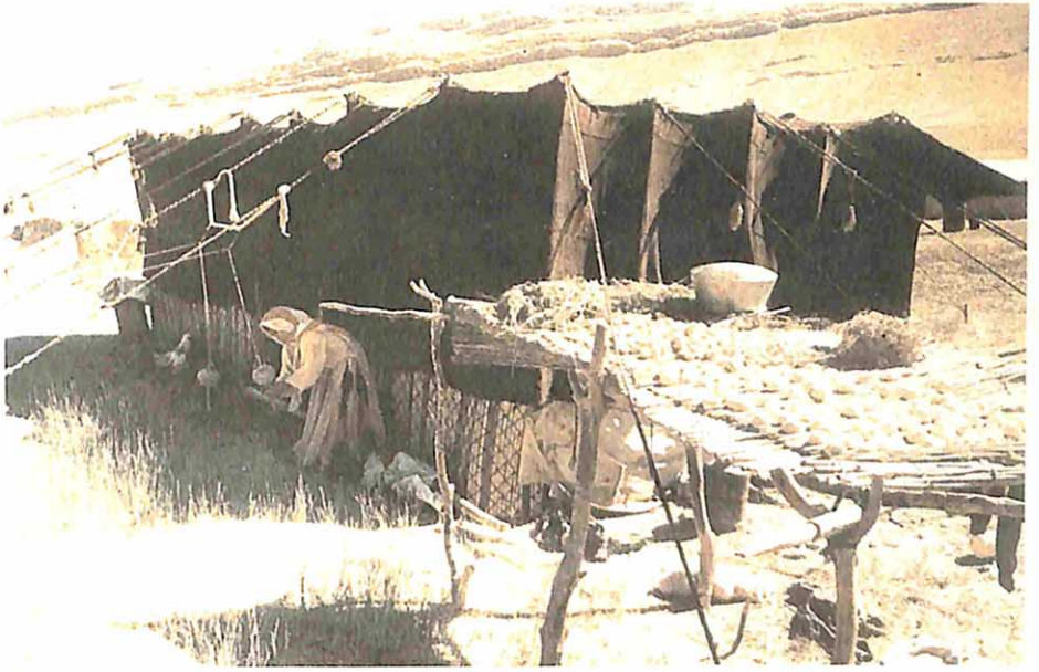
İran Türklüğünde göçebe çadırı